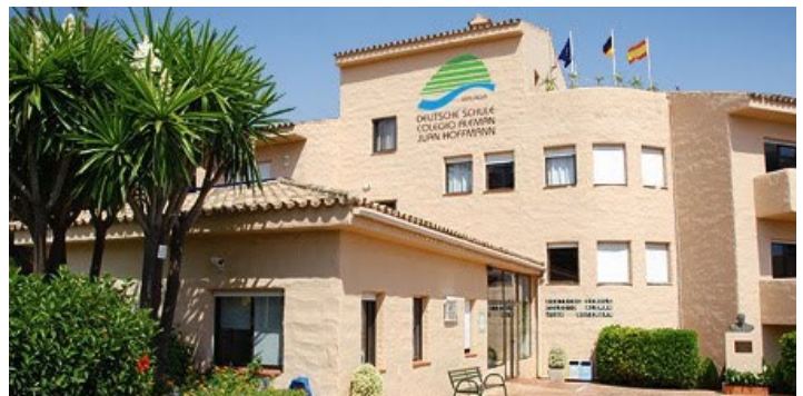
La escuela en Málaga vista desde afuera