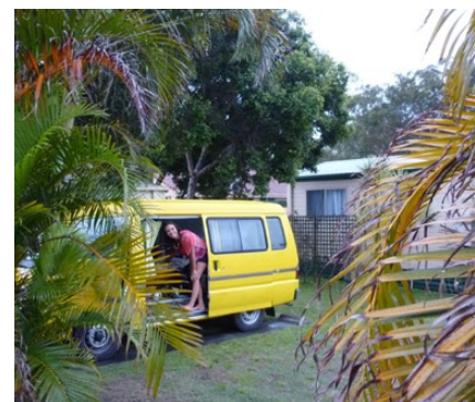
Anja y Tweety