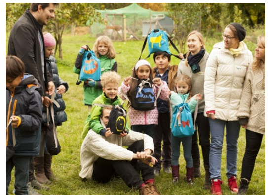
El trabajo de la joven asociación AMUZA e.V. está dirigido al apoyo de niños refugiados y gracias a sus mochilas AMUZAbags se logra que niños de diferentes culturas pasen tiempo juntos y se diviertan. Más información en www.amuzabag.com

www.weltwaerts.de/de/wie-erhalte-ich-Förderung-fuer-meine-aktion.html