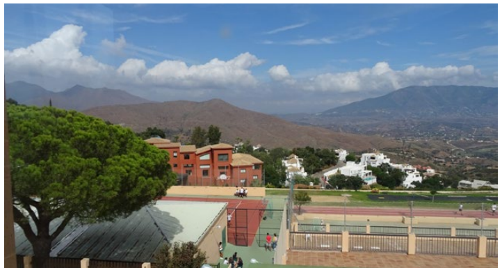
Le vu de la salle de séjour des volontaires