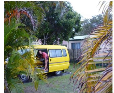
Anja y Tweety