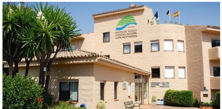
L'école à Malaga de l'extérieur