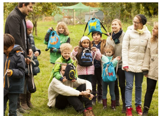
Le jeune club AMUZA e.V. de Kassel s'engage pour des enfants réfugiés et les AMUZAbags apportent un sentiment d'échange et de plaisir. Plus d'informations sur : www.amuzabag.com

www.weltwaerts.de/de/wie-erhalte-ich-Förderung-fuer-meine-aktion.html